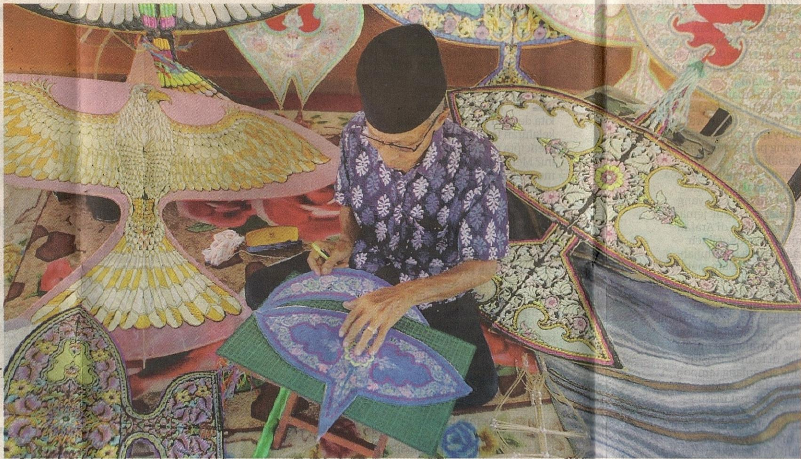
NAMPAK mudah namun penghasilan wau memerlukan ketelitian dan kreativiti serta teknik dalam menghasilkannya.

buluh duri yang kemudian dipotong kecil dan dijemur sehingga kering.